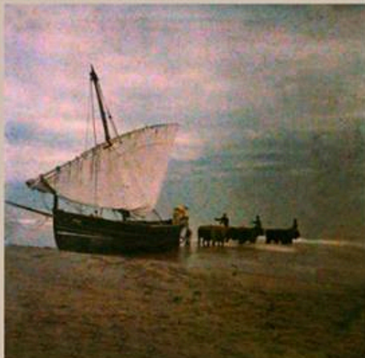
Bueyes arrastrando la barca. Placa autocroma

El día 15 de Febrero de 1921, fallece Arturo Cerdá en su domicilio familiar de Cabra del Santo Cristo, a la edad de 77 años.