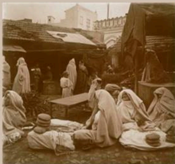
Tanger, Gran Zoco