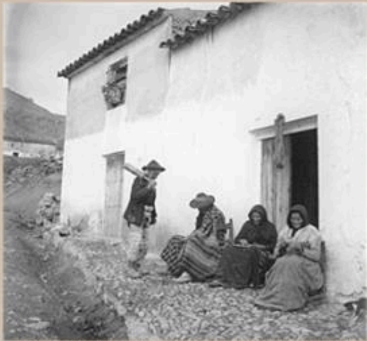
Paisanos a la puerta de la casa que luce en su dintel una madeja de esparto como anuncio de su venta

El día 15 de Febrero de 1921, fallece Arturo Cerdá en su domicilio familiar de Cabra del Santo Cristo, a la edad de 77 años.