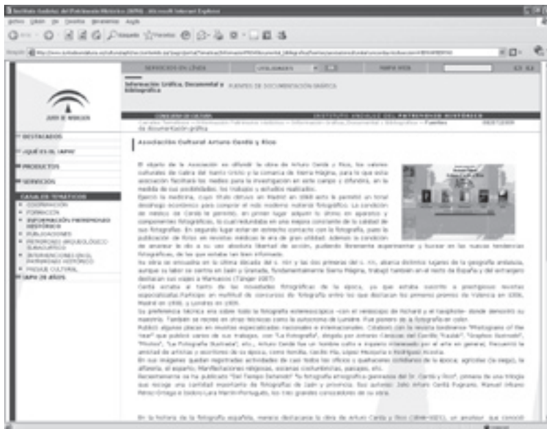
Página dedicada a ACACYR en el portal de la Fototeca del IAPH