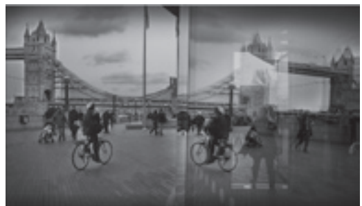
Algunas fotos de la serie que ha obtenido el segundo premio