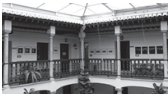
Mayo de 2009. Aspecto de la exposición en el centro de lenguas modernas de la Universidad de Granada