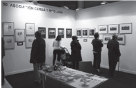
ArtJaén 2008. Aspecto del stand de la Asociación Cerdá y Rico

El objetivo principal de Art Jaén, es realizar el primer gran evento artístico cultural en Jaén y a través de las mejores galerías, tanto nacionales como internacionales, dar a conocer las últimas tendencias del arte contemporáneo, y proyectar a la provincia de Jaén como punto de referencia cultural, baluarte de la actividad artística internacional para el arte contemporáneo. En un evento como este, la exposición con las obras ganadoras y finalistas del 6º certamen internacional Cerdá y Rico de Fotografía, tuvo cabida, de manera que Acacyr estuvo presente en esta feria de arte moderno con un stand que se pudo visitar en la Institución Ferial de Jaén entre el 27 de noviembre y el 1 de diciembre de 2008.