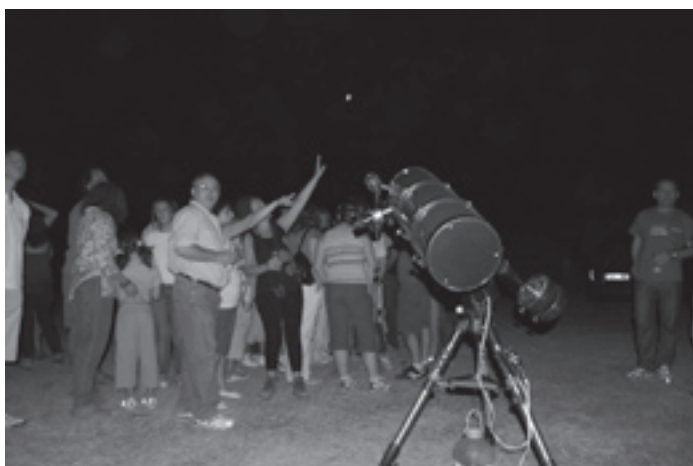
Un aspecto de los participantes en la reunión de amigos de la astronomía

A partir de las 20:00 horas fueron llegando los inscritos al lugar de concentración, el complejo Vergilia , en la estación de Cabra, donde pudieron degustar un magnífico aperitivo por gentileza de este establecimiento hotelero. A las 22:00 horas todos los participantes se desplazaron hasta el cortijo “Cújar”, en cuyas inmediaciones