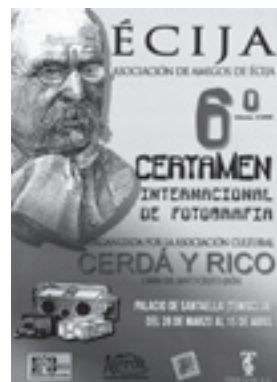
Cartel anunciador de la exposición celebrada en Écija (Sevilla)

Al cierre de esta edición, la A.D.R. Sierra Mágina ha concertado la exposición para Jaén. Será en la sala Maestra de la Caja de Jaén y se podrá visitar desde el 4 al 16 de septiembre. Probablemente, al igual que el pasado año, vuelva a nuestra capital para la feria de arte contemporáneo que se celebra a final de año en IFEJA.