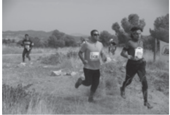
Corredores llegando a meta durante la carrera media celebrada en el paraje de "Las Hermanillas"

Más de 125 corredores se dieron cita del 22 al 24 de agosto en Cabra del Santo Cristo para disputar una nueva edición de trofeo de orientación creado hace 4 años por la Asociación Arturo Cerdá y Rico. El ambiente hospitalario de Cabra y el buen nivel organizativo han hecho de este trofeo un referente para los orientadores de toda España y ello explica que además de corredores procedentes de toda Andalucía (de nuevo era prueba puntuable para la Liga Andaluza) hubieran representantes de Catalunya, Madrid, Murcia e incluso Portugal y Reino Unido.