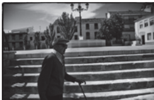
Algunas fotos de la serie que ha obtenido el premio Mágina