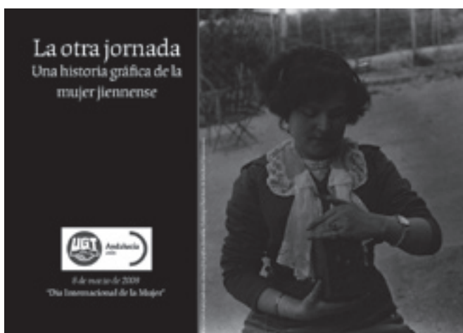
Portada del catálogo editado para la muestra

Esta muestra se inauguró en la sede de UGT-Jaén el pasado 8 de marzo de 2009, coincidiendo con el día de la mujer trabajadora y posteriormente se expuso en la sede regional que este sindicato tiene en Sevilla.