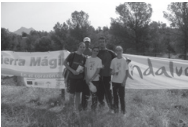
Algunos de los participantes del II curso de orientación de la ADR Sierra Mágica