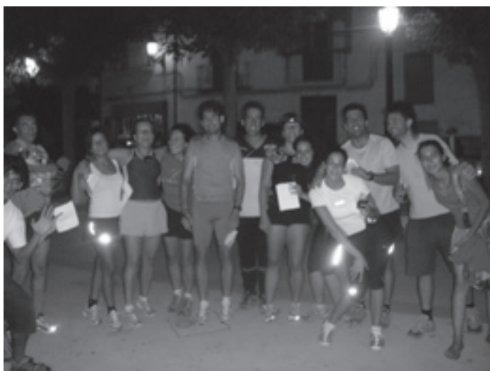
El COUH de Huelva, siempre a tope

feliz, y han de estar atentos porque a la que el último dé el trago final a su cerveza, se da la salida en masa. Y en efecto, en un plis plas los 60 salen en todas direcciones... especialmente algunos Adultos hacia la baliza 33, donde hay un "avituallamiento" en una construcción. Es la sorpresa de la carrera, en dicha casa, en la cocina, está la baliza y quien quiera tiene un avituallamiento de ponche cabrileño para degustar. Cuando lo saben algunos que no corren, piden el mapa para ir a ver el ambiente y hacer fotos. Los corredores adultos llegan y algunos no beben nada, otros un vaso, otros dos... el récord lo ostentarán algunos integrantes del COUH de Huelva, que están aprovechando a todo tren el ambiente de Cabra y hasta 6 vasos vacían. En la plaza llegan los primeros de las dos categorías, a los chavales no adultos, que no tienen el citado control, la organización les procura un avituallamiento de refrescos bien fresquitos. En 1 hora, todos ya habrán llegado, muchos encantados con la experiencia y las risas echadas.