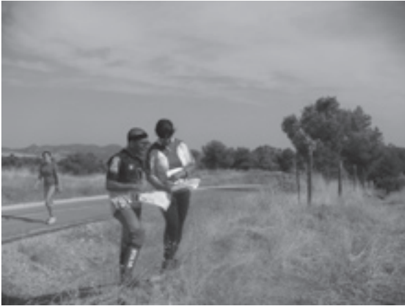
Orientadores portugueses departen después de la carrera media en las Hermanillas