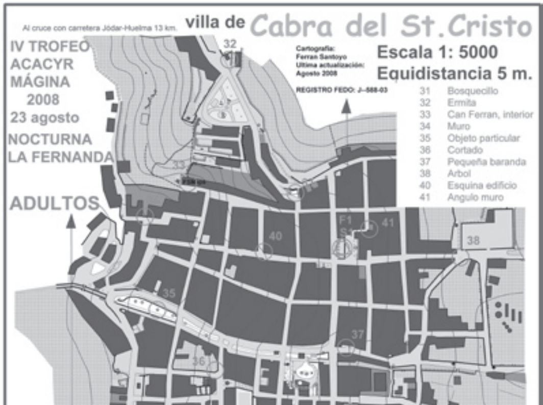
Mapa de “la Fernanda”