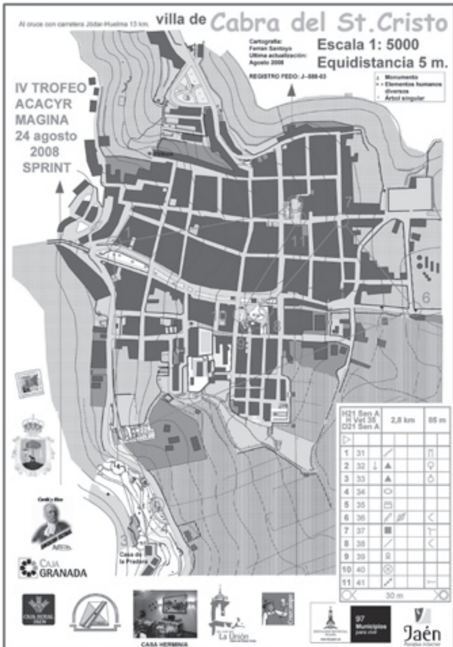
Mapa del Sprint