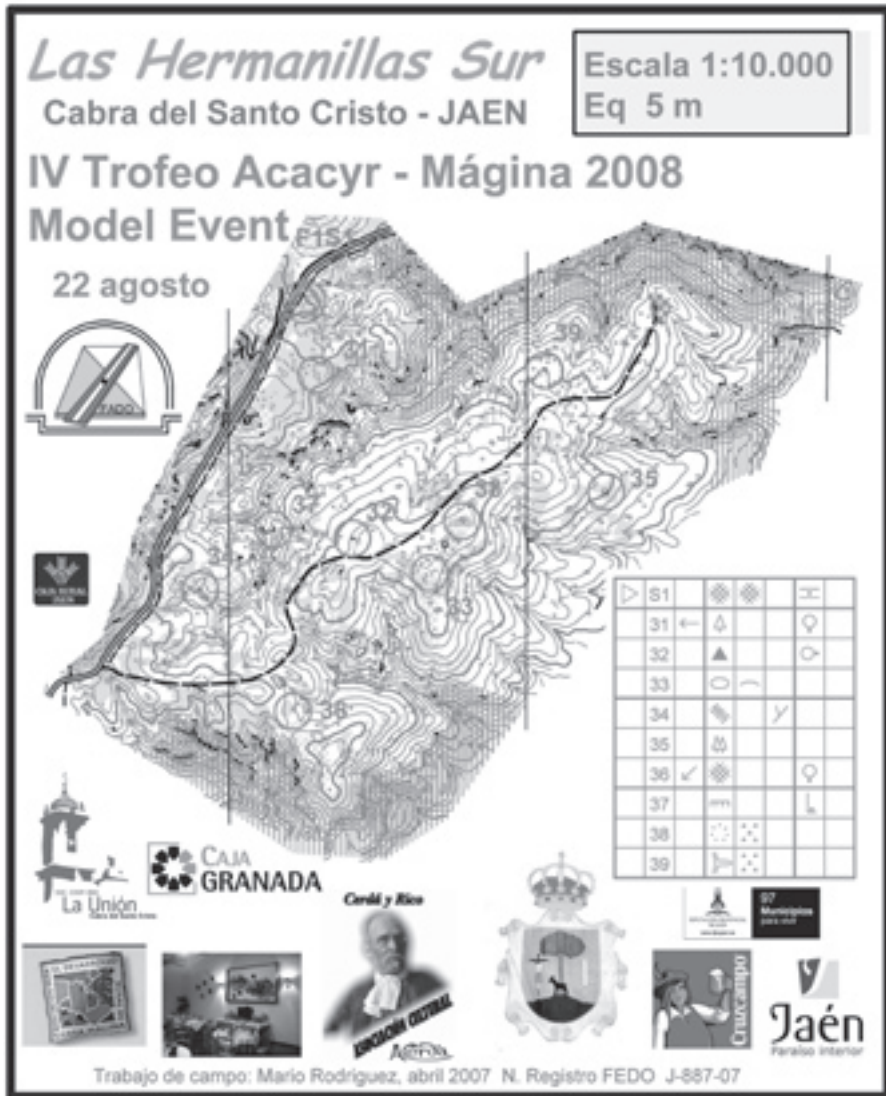
Mapa del Model Event