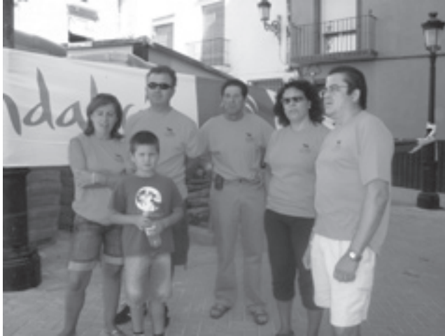
Los voluntarios de Acacyr no faltaron a la cita

y una silla para coger los tiempos manualmente de los corredores de iniciación y Open. ¡A las 10 en punto, primera salida! Durante poco más de una hora, los orientadores se desparramarán a ambos lados de la carretera local de Cabra, cada uno a la búsqueda de sus objetivos, en un día no demasiado caluroso, con algunas nubes en medio del cielo azul. A partir de las 10.30 comienzan a llegar los primeros que concluyen sus recorridos. Todos sudorosos, con una grata impresión del mapa y el terreno, así como un trazado bueno en complicación y que combina todas las técnicas. Los que ganen las categorías harán entre 30 y 40 minutos, los últimos como mucho sobre la hora, justo lo programado por la dirección técnica para que la carrera no se haga larga y todos puedan volver a Cabra para descansar. En efecto, sobre las 13.00 llegan los últimos participantes, que también fueron los que salieron más tarde, y se procede a recoger salidas y llegadas, así como los controles. A las 14 horas se imprimen los resultados y ¡a la piscina!, donde era de esperar y como en otros años se reúne el grueso de competidores tomando un baño, estirándose al sol y degustando refrescos, cervezas, paellas y platos combinados.