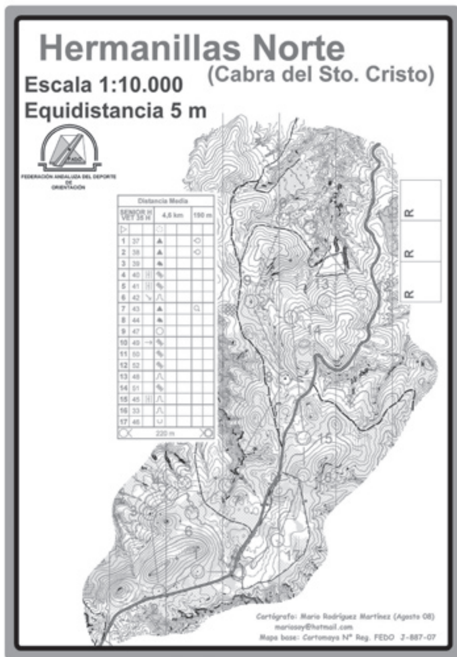
Mapa de la carrera media