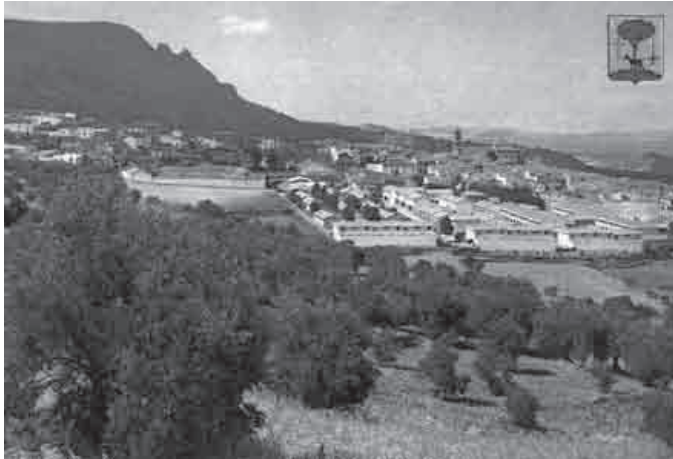
3. Postal que ilustró la portada del programa de las fiestas de 1.970 y donde aparece por primera vez el escudo actual de la localidad

1.970. Puede que de un año antes, ya que en la portada y contraportada del programa de este año salían publicadas sendas postales de una panorámica de la localidad y de la calle Soto respectivamente, las cuales ya contaban con el escudo actual en uno de sus extremos. Entiendo por tanto que fueron publicadas en ese programa por la novedad que estas suponían. Es más, mi intuición me dice que muy posiblemente nuestro escudo actual fuera diseñado con motivo de la tirada de estas postales.