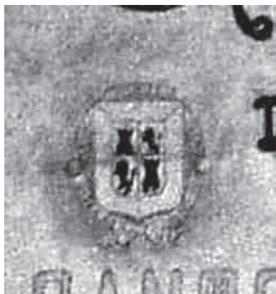
1.- Escudo que ilustra el cartel de fiestas de 1.897

escudo actual-, cuando comenzó a utilizarse con mayor frecuencia, sí que existen testimonios de su uso, al menos, desde finales del siglo XIX.