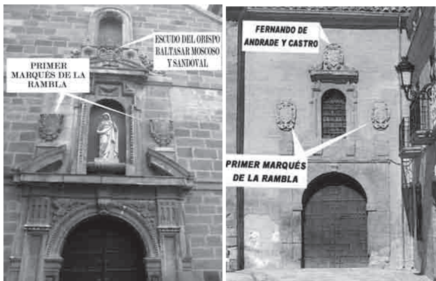
6 y 7.- El escudo de José de San Vitores, primer Marqués de la Rambla, aparece a ambos lados de las dos portadas de entrada a la Iglesia-Santuario del Cristo de Burgos. La parte alta de estas portadas estaba reservada al blasón del Obispo vigente en el momento de la construcción.

Se publican en este trabajo tres escudos diferentes, aunque todos pertenecen al título de marqués de la Rambla. El primero se encuentra en el altar mayor de la iglesia de Cabra y flanqueando la portada principal y la puerta del sol, se trata del primer escudo de este título; el segundo se encuentran en el altar mayor de la iglesia de Cabra (calle derecha según se