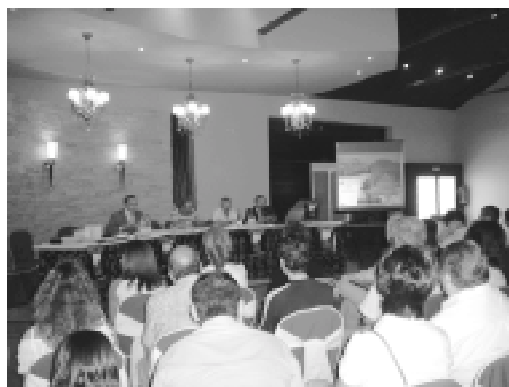
Agosto de 2005. Presentación nº 2 de Contraluz y entrega de premios Cerdá y Rico.