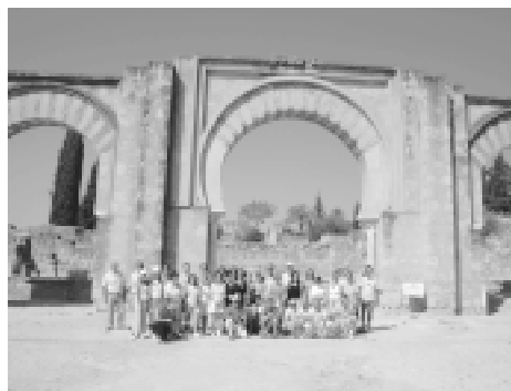
Viaje cultural a Córdoba. Agosto 2005.

A las 12,30 comenzó la visita al palacio de Viana, hermoso monumento que atesora en su interior, además de un precioso mobiliario, tapices, valiosas colecciones y unos patios de