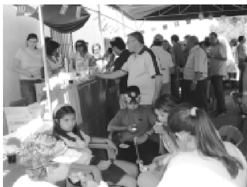
Aspecto que ofrecía la caseta instalada por Acayr en la pasada romería de la estación.