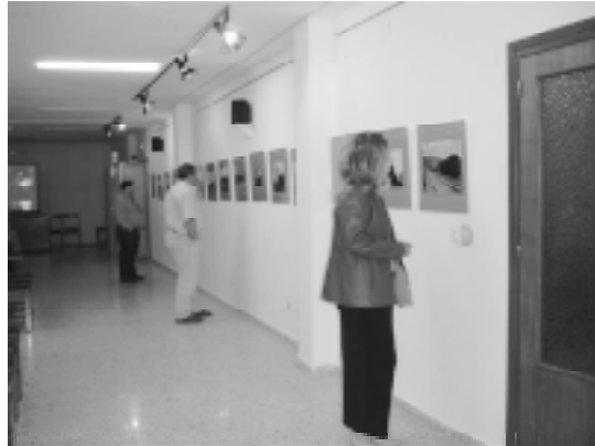
Marzo de 2005. Aspecto de la Exposición.

obras de ingeniería singulares, diseñando su recorrido por espacios que en algún caso tenían una baja densidad demográfica, pero también sirvió de vía de comunicación para algunas de las ciudades más importantes del Sureste andaluz. En su momento fue bandera de reivindicación, para convertirse años después en motivo de desilusión, aunque no desprovista de un estado de permanente esperanza.