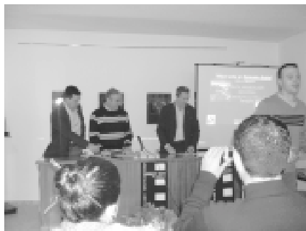
Acto de entrega de premios del III Certamen Internacional Cerdá y Rico de Fotografía. 10 de diciembre de 2005.

El tercer Certamen Internacional Cerdá y Rico de Fotografía superó ampliamente las expectativas creadas en cuanto a participación y calidad se refiere. Más de un centenar de participantes presentaron una cantidad superior a las 600 fotografías, en las que predominó una alta calidad artística.