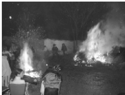
San Antón 2006.

junto a la conocida como “fuente de los gitanos” y la otra, en la confluencia con la calle San Blas. Los vecinos que organizaron estas lumbres recibirán una paletilla como premio al ambiente reinante durante esta mágica noche en la que los cantes típicos y las ruedas alrededor del fuego fueron una constante que puso el toque de autenticidad que cabe esperar de esta tradicional fiesta.