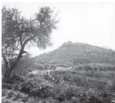
Castillo de Cabra Sto. Cristo. h. 1900

Trabajo publicado en SUMUNTÁN n° 9. Ampliado y corregido. CISMA - Carchelejo (1998); P. 109-124 - I.S.S.N: 1132-6956