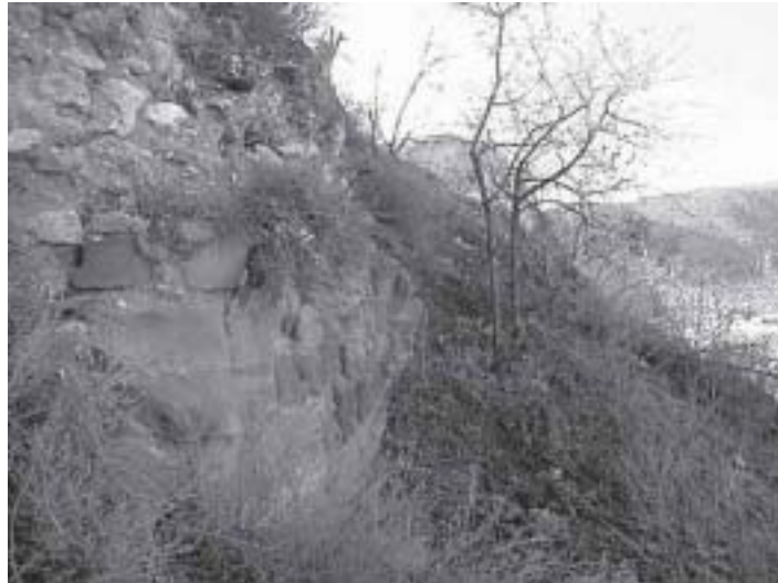
Sillares de asperón en la base de la cara Norte.

Los materiales empleados son la mampostería sin trabajar mezclada con mucho mortero de barro y cal. El torreón Este presenta también algunas hiladas de sillares de asperón trabajado en la base de la cara Norte.