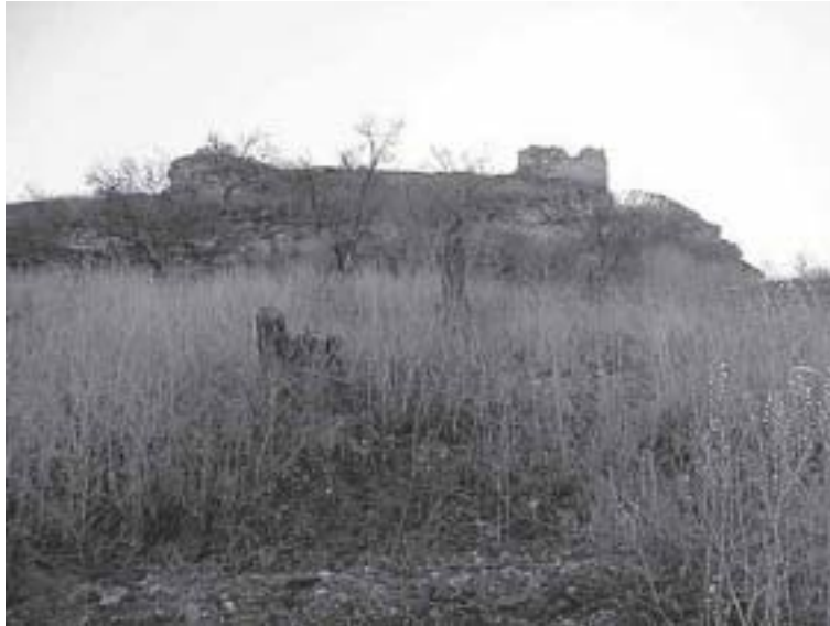
Lado Norte del castillo.