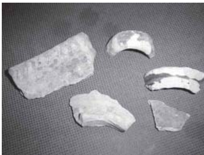
Restos cerámicos recogidos en el cerro San Juan.

Además, esta cerámica resulta vital para conocer la cronología del asentamiento. En general encontramos cerámica muy variada (dejando a parte las tejas): Desde grandes tinajas a mano hasta vajilla doméstica a torno (jofainas, tapaderas, candiles, cuencos, etc.). En muchos casos encontramos cerámica pintada, con bellos estampillados o con vidriados en verde manganeso, aunque con un acabado un tanto irregular.