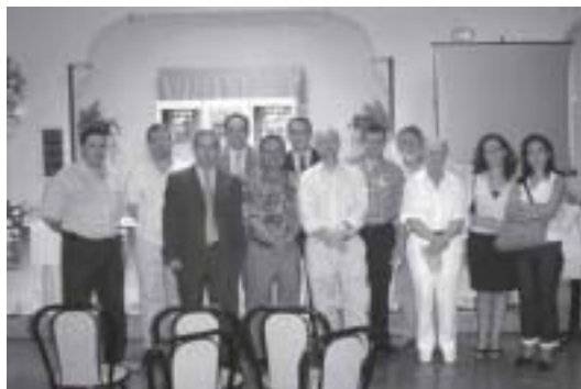
Algunos de los colaboradores de Contraluz